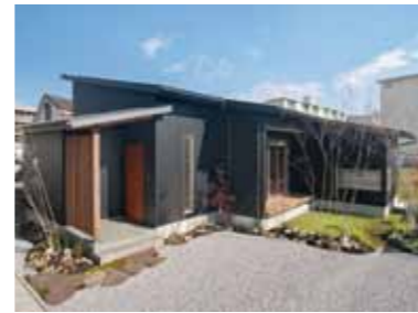
「くらしばこ」の外観。庭間の豊かさを各部屋に取り込んでいます。

変形土地というウィークポイントを家の強みとして捉え、庭やLDKのつながりを工夫することで生まれた心地良いデザイン。リビングに併設された小上がりのタタミコーナーやキッチンを中心とした家事動線、リビングの床暖房など、スタイリッシュさと暮らしやすさを兼ね備えたモデルとなっています。上質な暮らしにこだわりの家族に、大きな満足をもたらすことでしょうか。