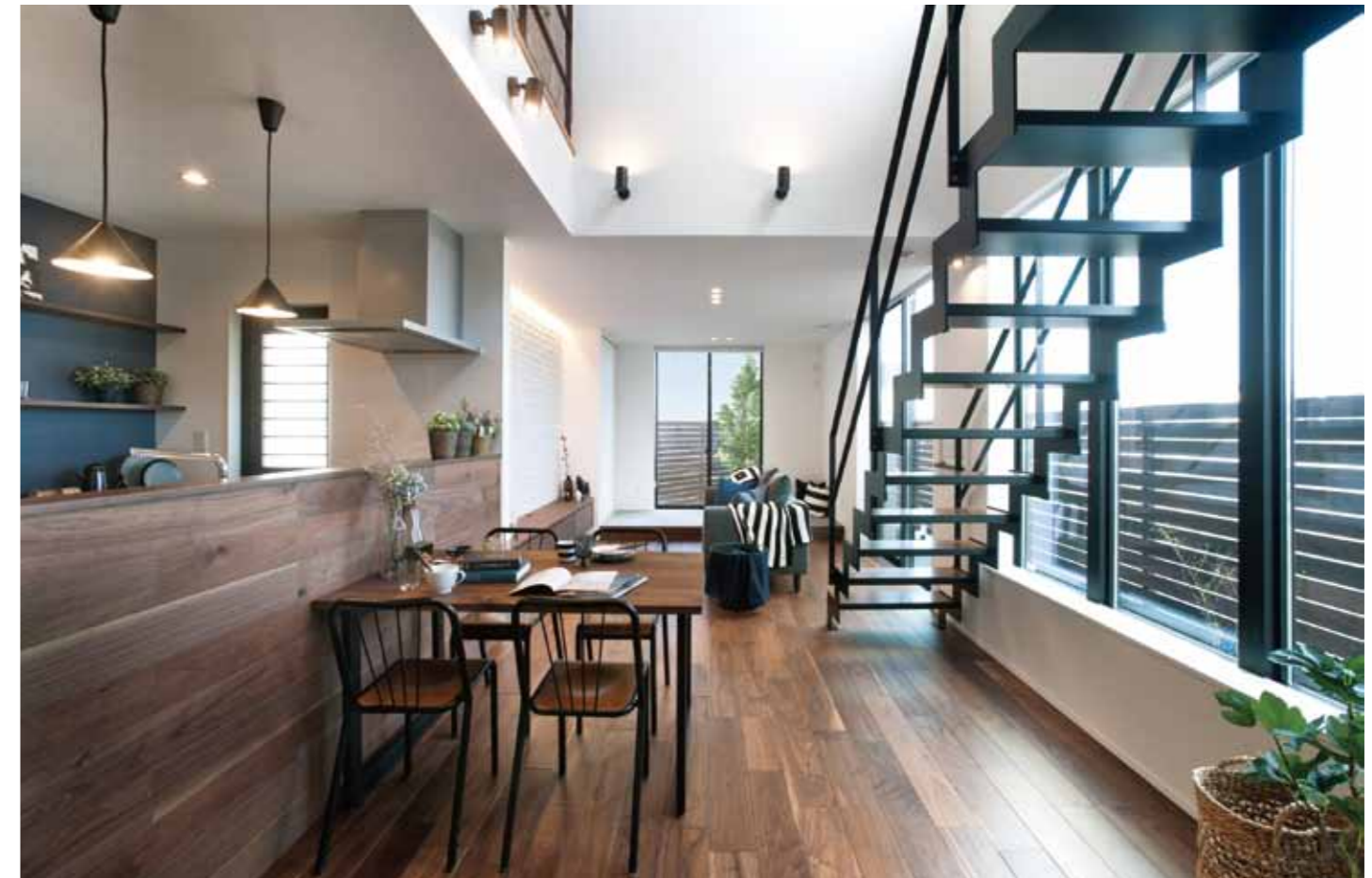
モダンでスタイリッシュな提案型分譲住宅「G」-style。ひき板のフローリングやスチール階段など、こだわりが随所に散りばめられています。

●提案型分譲住宅「G」-style /板野郡藍住町徳命字元村東76-16(ネクステージ藍住徳命内)