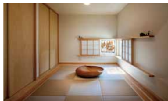
LDKや庭間とつながる和室は雰囲気たっぷり。引き戸を開めることで個室として使うことも可能です。

LDKとつながる和室は、建具を開閉することで客間や寝室として活用することが可能。洋室も2部屋用意されているため、子ども部屋や夫婦の寝室など、ご家族の成長に合わせて自由に使うことができるのも嬉しいポイントです。スタイリッシュな日々を演出する「G」-style、ミニマムな空間で豊かに暮らす「くらしばこ」。同社が自信を持ってお届けする2つのラインナップを、ぜひ家づくりの選択肢に加えてください。