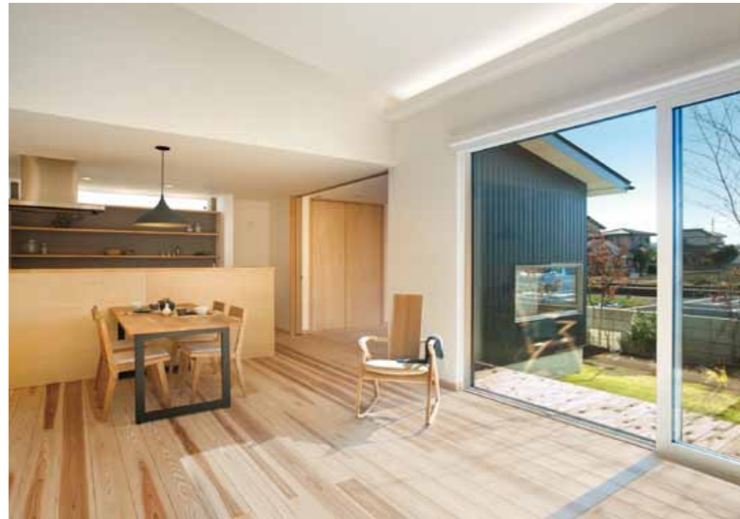
庭間の風景を活かしたLDK。天井にメリハリをつけ、窓の配置によって視線の抜けを確保することで開放感を高めています。