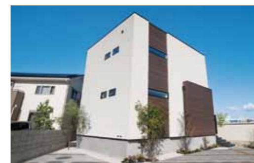
落ち着いた色の木材を用いた外観もシンプルでスタイリッシュ。玄関ポーチには、テラスや裏庭への動線も設けられています。

県内の注文住宅着工数にて12年連続1位に輝いた「はなおか」の家づくり。新たなラインナップとして加わった提案型分譲住宅「G」-styleと「くらしばこ」の魅力をご紹介します。