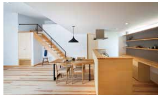
作り付けの収納や作業台を備えたダイニングキッチン。リビング階段は大容量の小屋裏収納へとつながっています。

自然素材をベースにしたシンプルな空間は、思わず時間が経つのを忘れてしまいそうなほどの心地良さ。平屋でつながるLDKや和室は、コンパクトながらも必要な距離感で家族を集めます。また、家のどこからでも四季の風景を楽しめるよう庭間を配置。ウッドデッキが内と外をつなぐ中間領域となり、勾配天井によってメリハリを