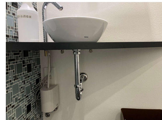
ハンドルなしタイプ