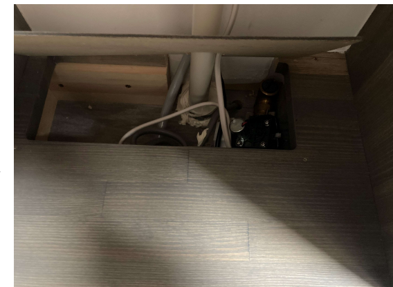
トイレ止水栓(底板開閉後)